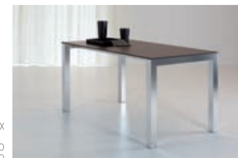
MIX DIM. 120 X 70 DIM. 140 X 80