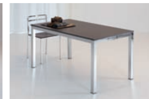
STYLING DIM. 120 X 70 DIM. 140 X 80