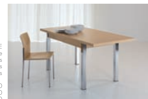
MARTE gambe cromate pieds chromés chromium-plated legs patas cromadas DIM. 100 X 60 DIM. 120 X 70 DIM. 140 X 80