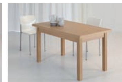
MARTE gambe legno pieds bois wood legs patas madera DIM. 100 X 60 DIM. 120 X 70 DIM. 140 X 80