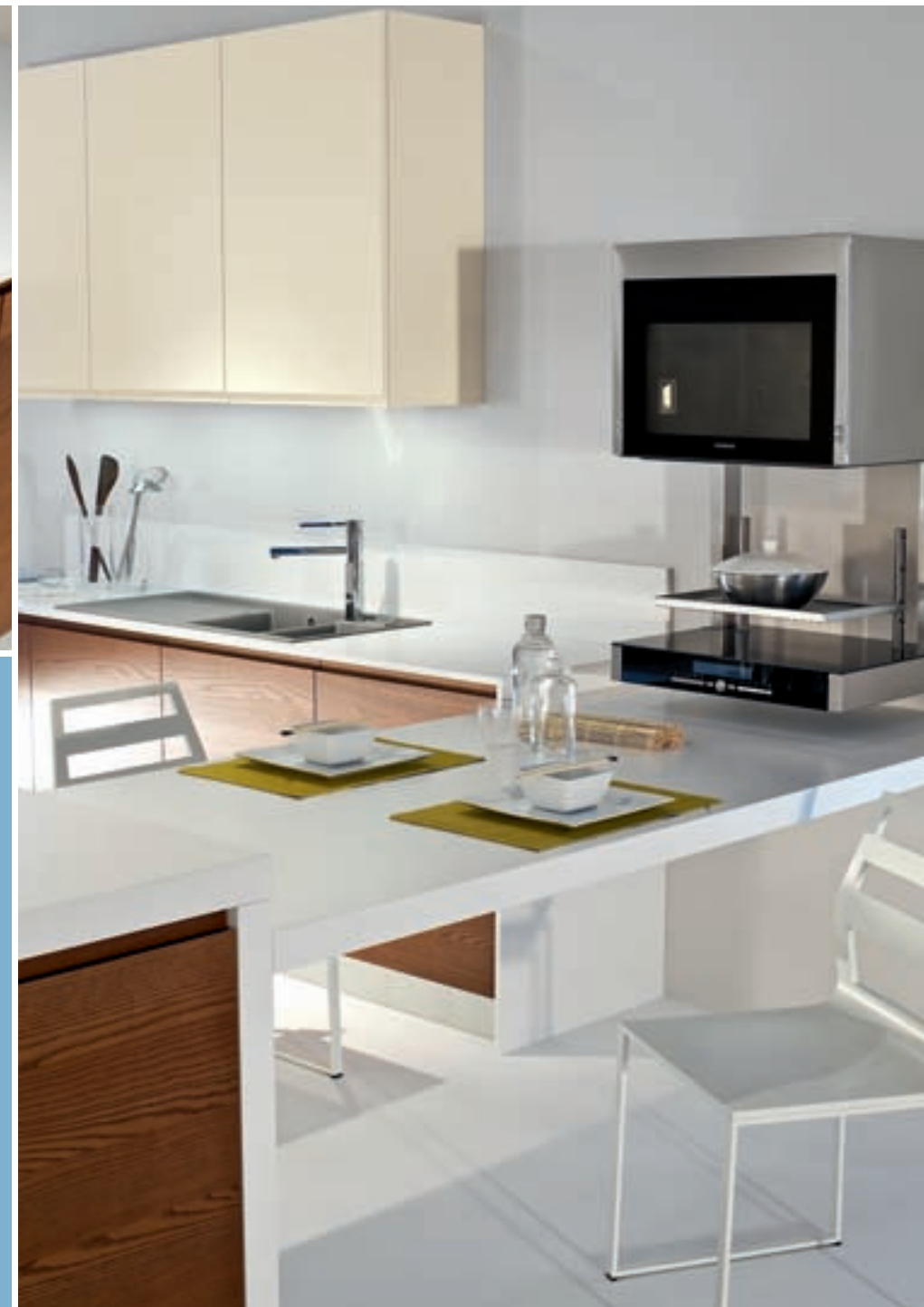
Piano lavoro e fianconi spessore 2 e 6 cm in laminato Bianco Dax con bordo Unicolor _ 2 and 6 cm thick top and sides in Bianco Dax laminate with Unicolor edge _ Plan de travail et jambages épaisseur 2 et 6 cm en stratifié "Bianco Dax" avec chant Unicolor _ Encimera y costados esp. 2 y 6 cms en laminado Bianco Dax con canto Unicolor.