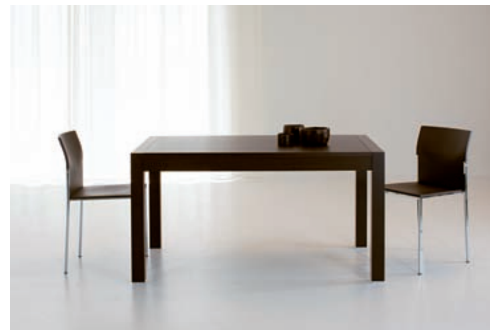
GIOVE DIM. 140 X 85