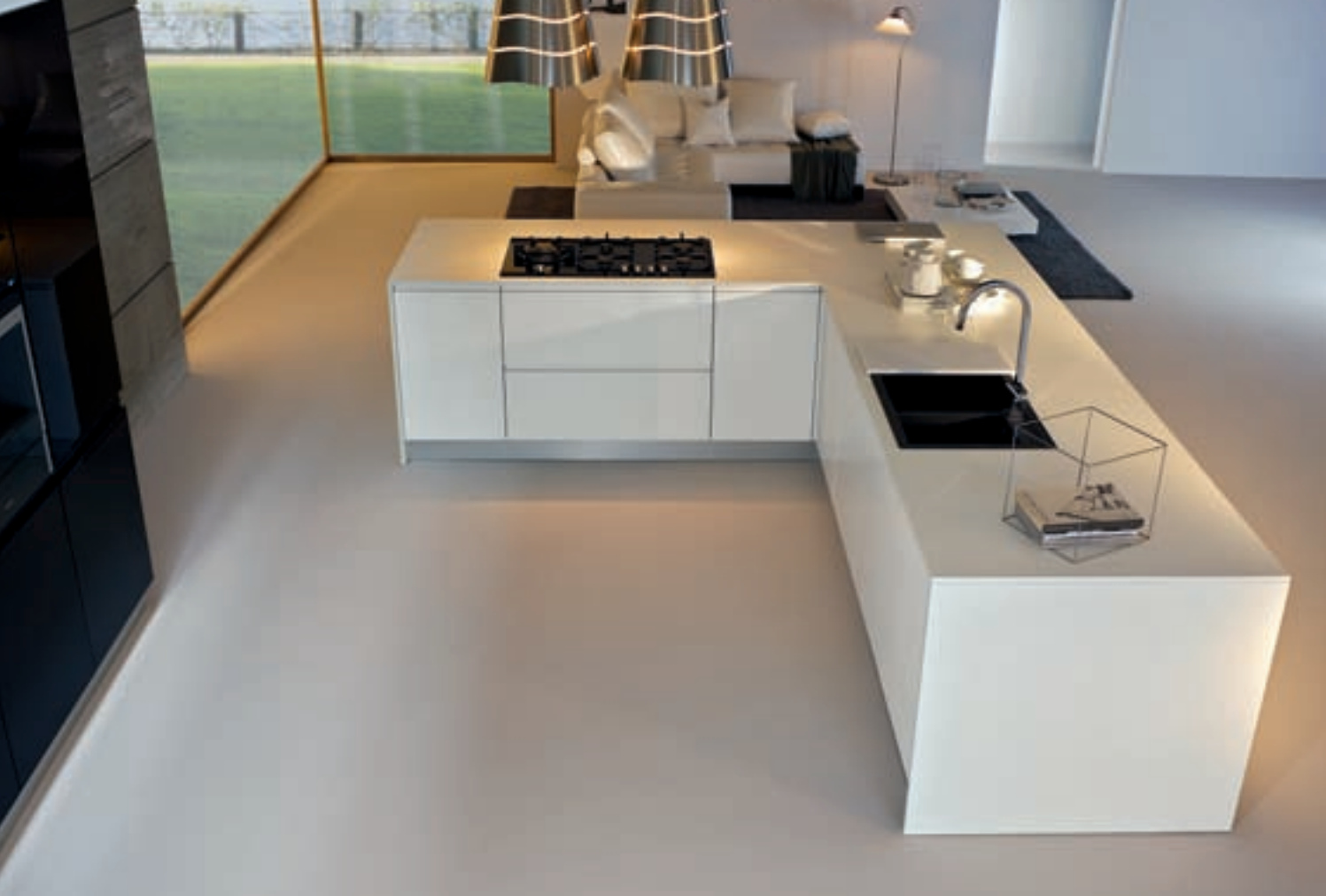
Ampio sistema ad isola con area operativa cottura/lavaggio _ Wide island with cooktop and sink _ Système îlot avec évier et plaque de cuisson _ Sistema isla con zona operativa cocción/lavado.