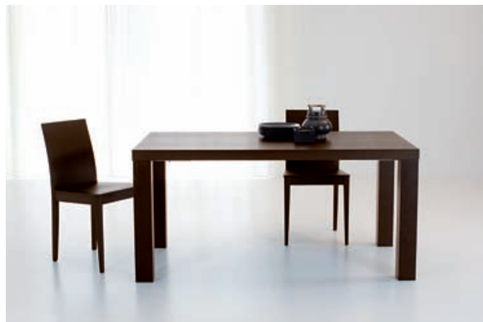
NETTUNO DIM. 160 X 90