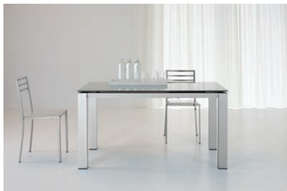
SATURNO DIM. 140 X 80