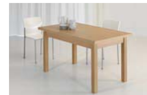
MARTE gambe legno pieds bois wood legs patas maderas DIM. 100 X 60 DIM. 120 X 70 DIM. 140 X 80