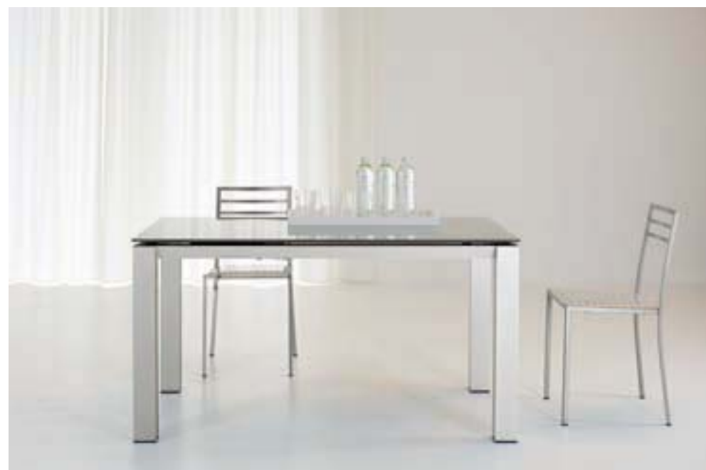
SATURNO DIM. 140 X 80