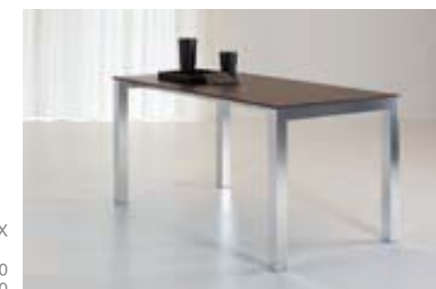
MIX DIM. 120 X 70 DIM. 140 X 80