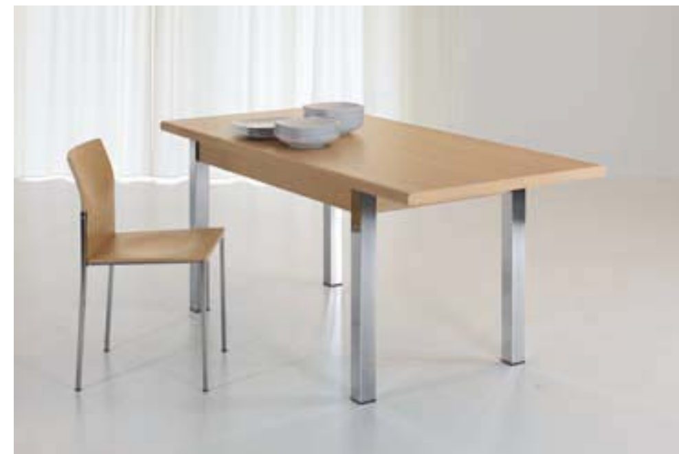
MARTE gambe cromate pieds chromés chromium-plated legs patas cromadas DIM. 100 X 60 DIM. 120 X 70 DIM. 140 X 80