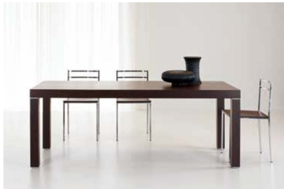
VENERE DIM. 140 X 85 DIM. 95X95