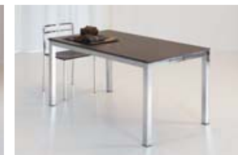
STYLING DIM. 120 X 70 DIM. 140 X 80